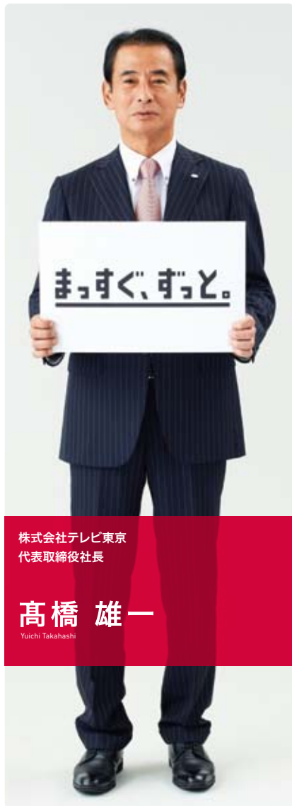
株式会社テレビ東京 代表取締役社長