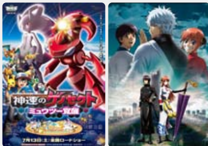
©Nintendo・Creatures・GAME FREAK・TV Tokyo・ShoPro・JR Kikaku ©空知英秋 / 劇場版銀魂製作委員会 ©Pokémon ©2013 ヒカチュウプロジェクト

夏の恒例、『劇場版ポケットモンスター ベストウイッシュ 神速のゲノセクト ミュウツー覚醒』は興行収入30億円を超えるヒットとなり、今回で16作目となるシリーズは累計で興行収入700億円