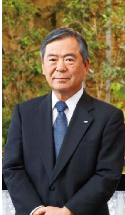
株式会社テレビ東京ホールディングス 代表取締役社長

「ネット関連事業を中心とする通信分野の開拓」では、経済や旅グルメといった強みを活かして新たなビジネスモデルを展開しています。テレビ東京の経済報道番組がスマートフォンなどで視聴できる「テレビ東京ビジネスオンデマンド」は有料サービス開始から順調にユーザー数を増やしています。テレビ東京グループのデジタル戦略を一元的に担うテレビ東京コミュニケーションズは、急速に拡大するスマートフォンやタブレット端末など、様々なメディアを通じて幅広い生活シーンにコンテンツをお届けいたします。