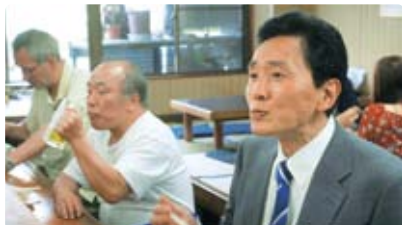
孤独のグルメ Season3 第2話「神奈川県横浜市日ノ出町のチートのしょうが炒めとパタン」 2013年7月17日(水)放送