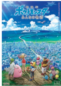
©Nintendo・Creatures・GAME FREAK・TV Tokyo・ShoPro・JR Kikaku ©Pokémon ©2018 ビカチュウプロジェクト